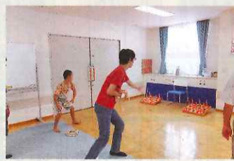
六角橋ヶアブラザ