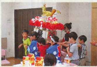
新子安ヶアブラザ