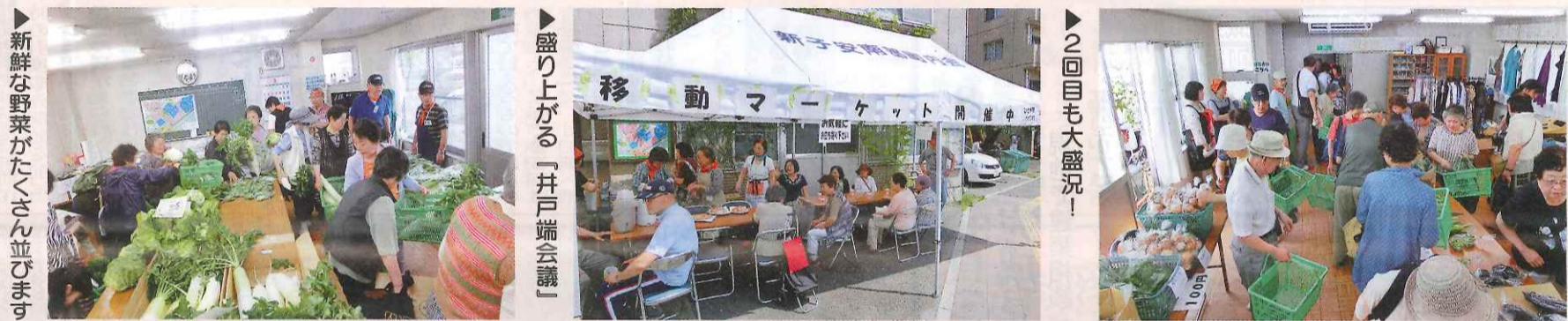
新鮮な野菜がたくさん並びます