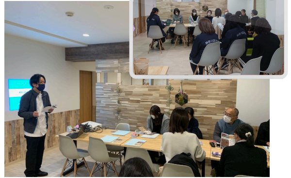
カフェタートル 職員の方のごあいさつ

年齢や体力の面で一般就労が難しい状況にある障がい者の方が、それぞれのペースで、就労に向けた訓練を行っています。