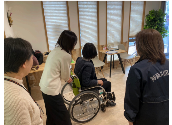
車いすの使い方講座の様子