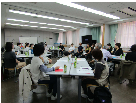
トークセッションの様子