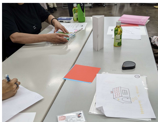
イラストワークで伝わりにくさを疑似体験