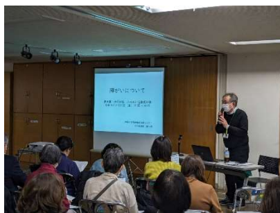
青木第一地区 研修