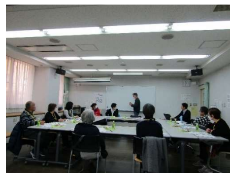
フォローアップ講座の様子